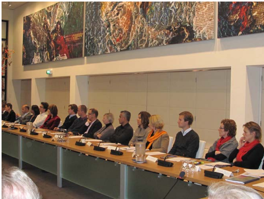
Incompany-dagen van het CBb

Op 15 en 16 november 2011 heeft het College incompany-dagen georganiseerd, waarbij de nadruk heeft gelegen op Europeesrechtelijke ontwikkelingen. De volgende onderwerpen zijn behandeld: “Nemo tenetur”, “Europeanisering van het markttoezicht”, “Europees recht als hoeder van onafhankelijkheid”, “Trends en ontwikkelingen Europa” en “Rechterlijke toetsingen in het kader van een meergelaagde rechtsorde”.