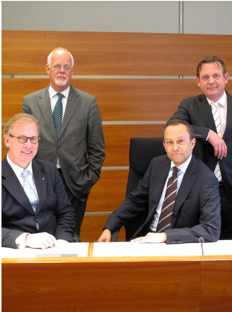
Bestuur van het College van Beroep voor het bedrijfsleven

Het bestuur, bestaande uit de president, twee sectievoorzitters en een directeur bedrijfsvoering, is belast met de algemene leiding van het College en draagt uit dien hoofde onder meer zorg voor de automatisering, de bestuurlijke informatievoorziening, de voorbereiding, de vaststelling en de uitvoering van de begroting, de huisvesting en beveiliging, de kwaliteit van de bestuurlijke en organisatorische werkwijze van het gerecht, personele aangelegenheden en overige materiële voorzieningen.