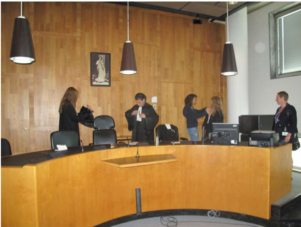
Studenten van het Zandvlietcollege bereiden zich voor op het naspelen van een zitting

Ook voor het komende jaar zijn er al meerdere aanvragen ontvangen vanuit diverse onderwijsinstellingen voor het bijwonen van zittingen.