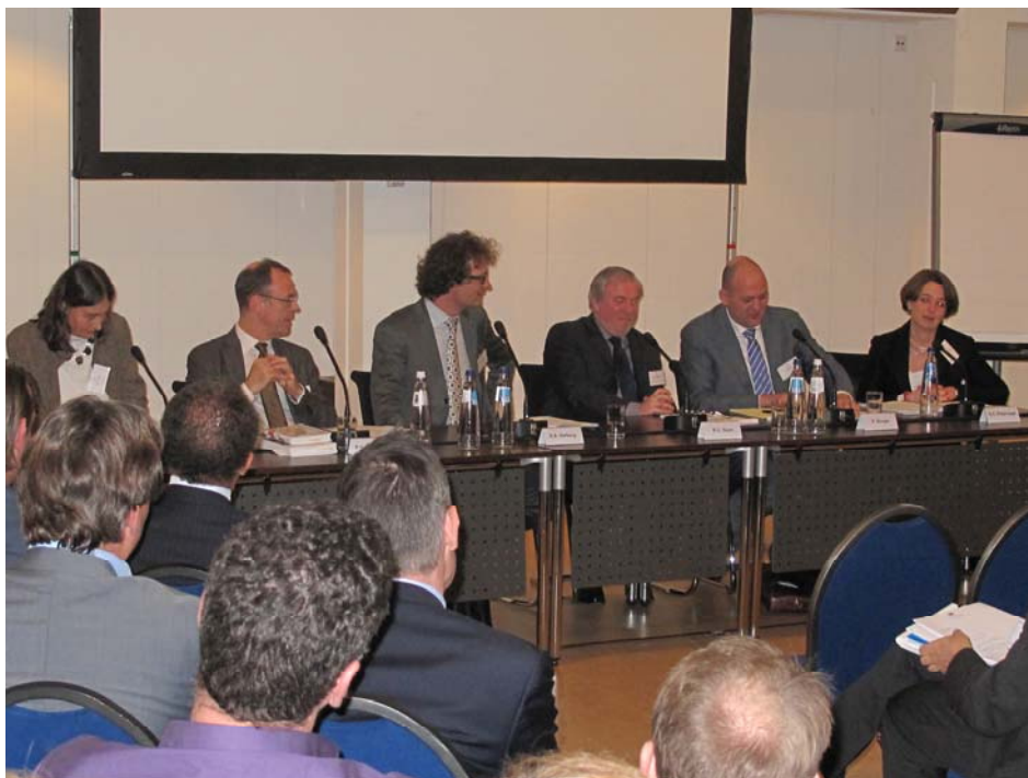
Zaal en panelleden tijdens Telecom conferentie

Naast de invoering van het vierstromenmodel is de externe oriëntatie verder versterkt. Het College heeft in het kader van prioritering van zaken en het inrichten van processen in 2011 overleg gehad met ketenpartners en partijen. Dit heeft in voorkomend geval geleid tot het houden van een regiezitting (gas en electra zaken). Daarnaast heeft het College, als gezegd, op 12 december 2011 een Telecom conferentie georganiseerd. Het doel van deze conferentie was het uitwisselen van ervaringen en wensen tussen het College en procesdeelnemers, om zodoende te komen tot de meest efficiënte inrichting van de betrokken werkprocessen. In reactie op deze conferentie hebben deelnemers laten weten dat het door het College genomen initiatief voor open overleg over verdere stroomlijning en bespoediging van processen bijzonder op prijs werd gesteld.