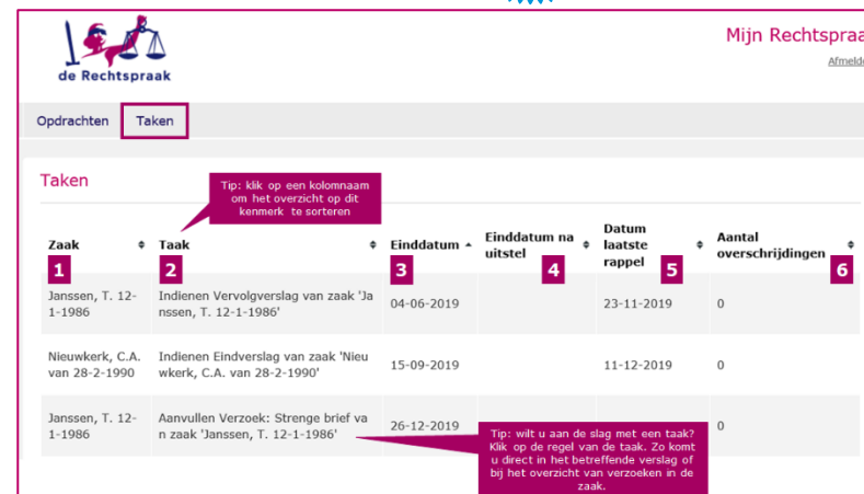
Schermvoorbeeld van het overzicht van taken in Mijn Rechtspraak voor faillissementszaken (boven) en Wsnp-zaken (onder)