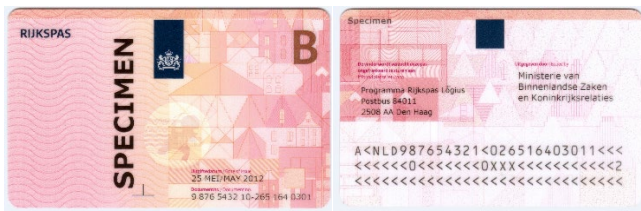
Figuur 5: Voorbeeld Rijkspas model-B