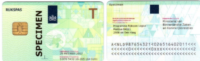
Figuur 3: Voorbeeld Rijkspas model-T

Voor tijdelijke medewerkers gelden dezelfde regels rond de Rijkspas als voor vaste medewerkers (zie paragraaf 4.1).