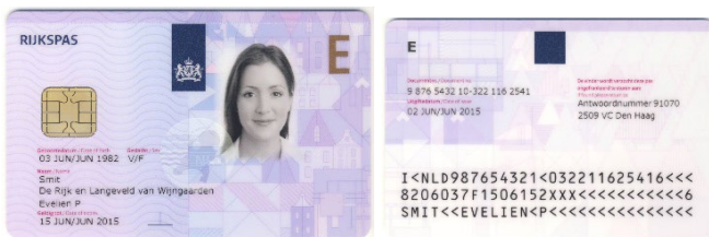
Figuur 4: Voorbeeld Rijkspas model-E

Ingehuurd personeel van derden kunnen een Rijkspas model E uitgereikt krijgen als ze die nodig hebben om hun werkzaamheden uit te voeren. Eventueel is de pas dan voorzien van de benodigde autorisaties waarmee zij zich vrij kunnen bewegen in het beveiligde gebied. Het gaat dan bijvoorbeeld om onderhoudstechnici, parketpolitie, schoonmaakpersoneel en uitzendkrachten. In het bijzondere werkgebied begeleidt een vaste medewerker altijd personeel van derden.